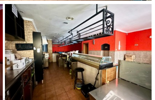
Local comercial en Elda, Gran avenida