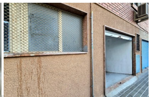
Almacén en Elda, Parque de Bomberos