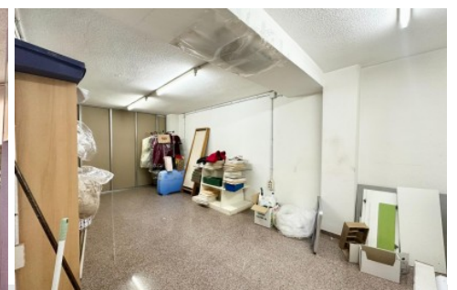
Piso en Petrer, Centro