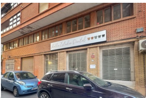
Local comercial en Elda, Plaza Castelar - Mercado Central