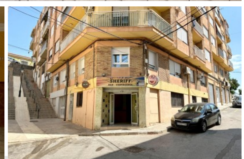
Local comercial en Petrer, La Foia